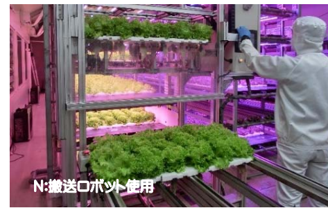
N:搬送ロボット使用

植物工場とは、施設内で植物の生育環境（光、温度、湿度、CO 2 濃度、養水分等）を制御して栽培を行う施設のことです。環境及び生育のモニタリングを通じて、高度な環境制御と生育予測を行うことにより、野菜などのきわめて高い生産性実現と周年・計画生産が可能となります。植物工場千葉大学拠点には、6つの太陽光利用型植物工場と3つの人工光利用型植物工場があります。