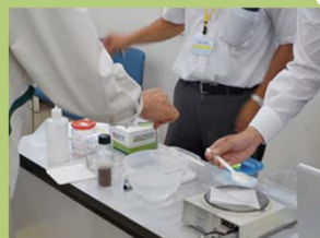
重炭酸を測定し、原水肥料も考慮した培養液組成を計算する