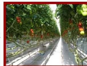
太陽光型植物工場

受講特典 : 自農場の培養液の分析を希望の方は、原水1点と実際に灌液に用いている培養液1点(計2点)の分析を致します。 ※培養液送付についての詳しい案内は確定通知に記載します