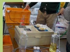
コントローラーのパラメータ設定と動作確認