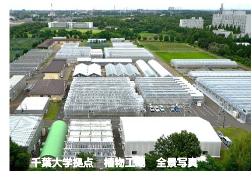
千葉大学拠点 植物工場 全景写真